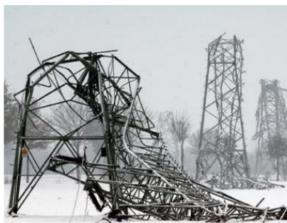
Kälte, Schnee und Eis

METEOTEST: Unser Team von Meteorologen steht täglich für einen kompetenten und persönlichen Dialog für Sie zur Verfügung.