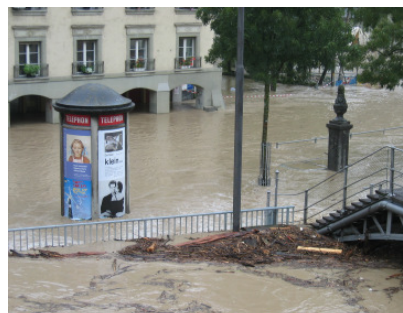
Regen und Überschwemmung