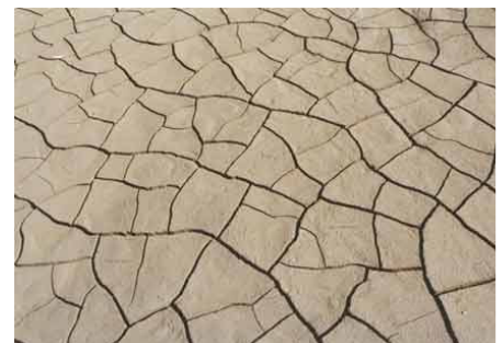
Trockenheit und Hitze

Genossenschaft METEOTEST Fabrikstrasse 14, CH-3012 Bern Tel. +41 (0)31 307 26 26 Fax +41 (0)31 307 26 10 office@meteotest.ch, www.meteotest.ch